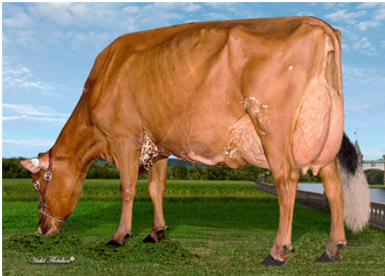
BELLEROUTE TUXEDO RIHANA DAUGHTER